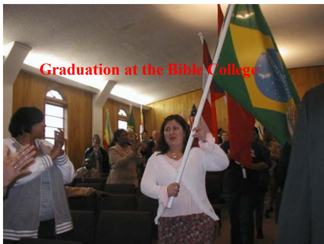
Muitos se graduaram nesta faculdade e alguns deles estão fazendo o Mestrado em Teologia no ITC.

We are also working to help our Brazilian immigrant community achieve their dream in the Atlanta area through a cooperative agreement with the Beulah Heights Bible College. This college hopes to become a university in 2006, and when it does so, students from our community can receive college credit for secular studies in addition to the Christian subjects they now take. Some of them have already graduated from Beulah Heights and are now enrolled in the Masters of Divinity program at Johnson C. Smith Theological Seminary.