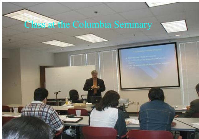
Class at the Columbia Seminary

Esse programa de treinamento compõe-se de 11 disciplinas. Cada curso é feito em um mês. O estudante faz oito horas à noite e quatro horas de trabalhos praticos durante o mês, envolvendo leituras e trabalhos escritos.