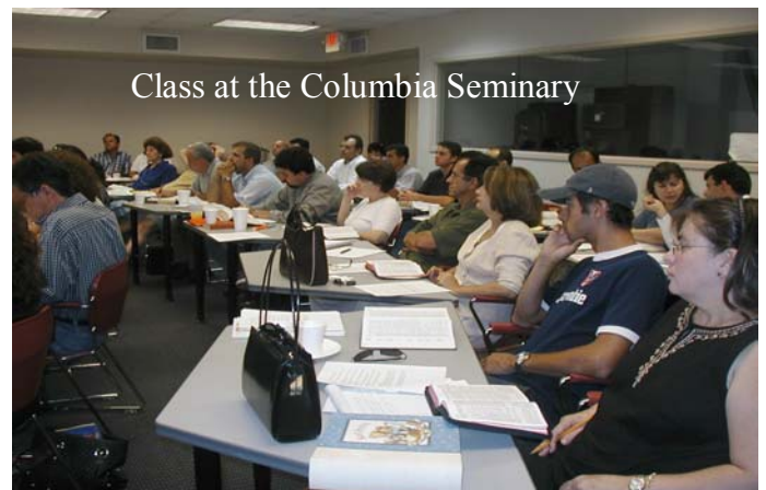
Class at the Columbia Seminary

In early February the fourth cycle of the Leadership Training Program will begin. The program comprises eleven courses. Each course may be completed in a month, during which the student takes two evening classes of four hours each and completes home assignments involving reading, writing, and a practicum. Completion of the Leadership Training Program fulfills the Book of Order requirements for commissioned lay pastors as well as being excellent training for lay leaders in a local church.