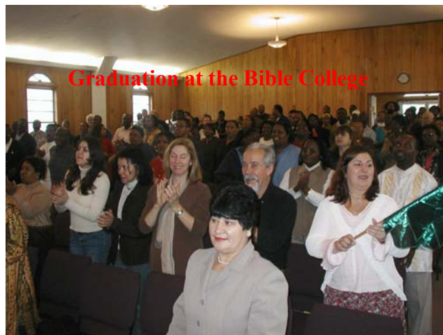
Many Brazilians graduated in this Bible School and some of them are already doing the MDIV at the J.C. Smith Theological Seminary.